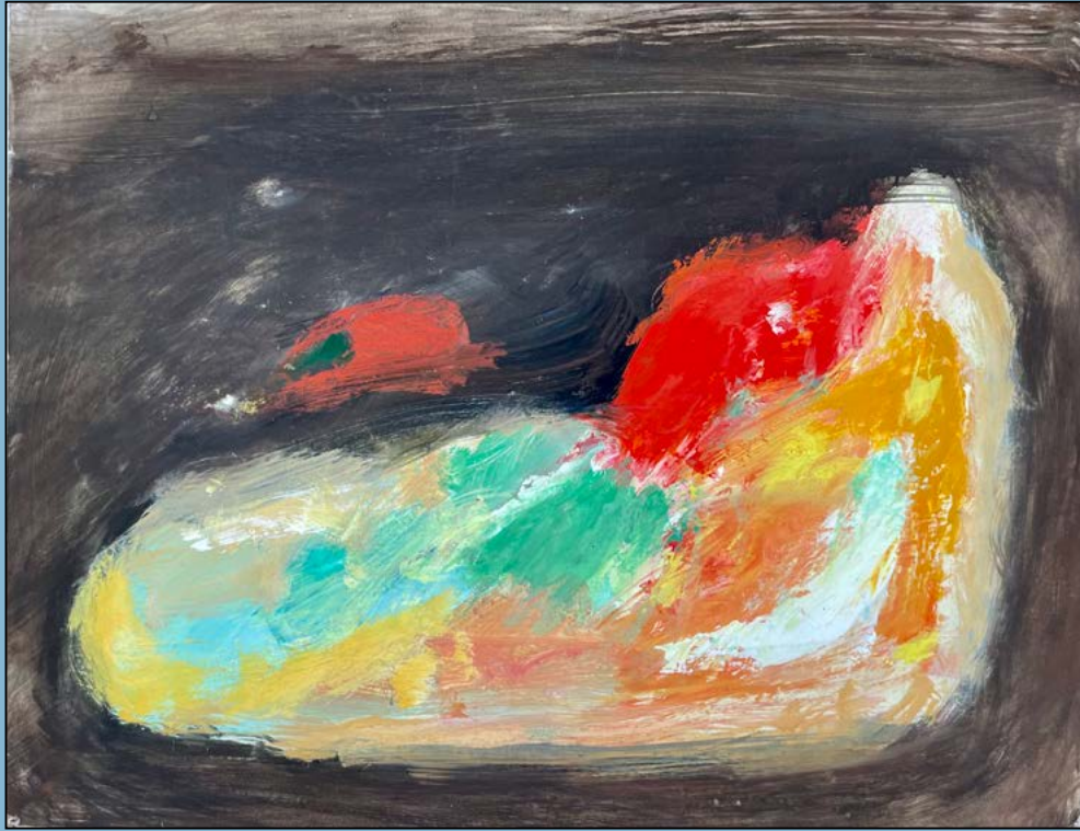
Colour, radiation of cosmic energy, 1993 Gouache 39 x 49 cm