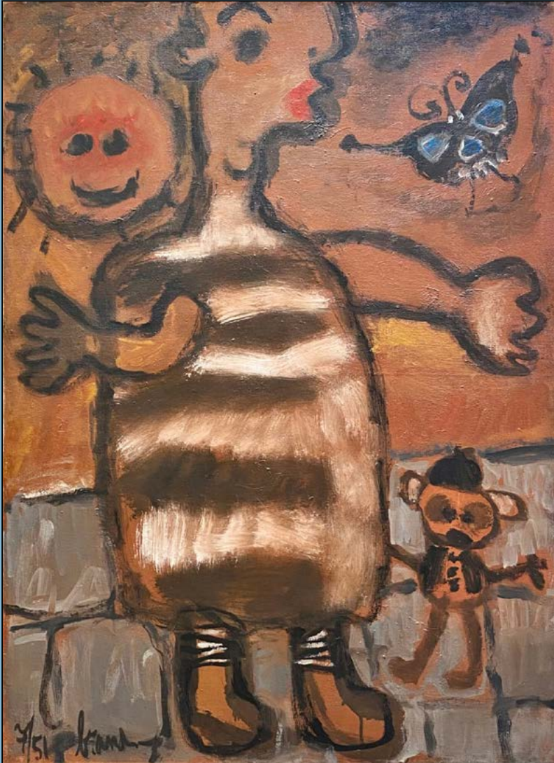
Meisje met vlinder, 1951 Olieverf op doek 103 x 75 cm