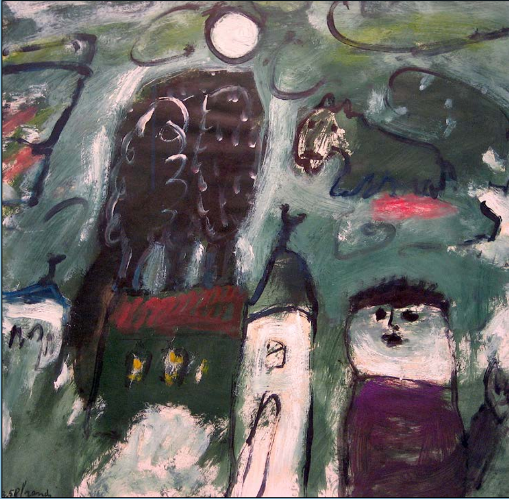
Maanlandschap, 1958 Olieverf op papier 48 x 50 cm