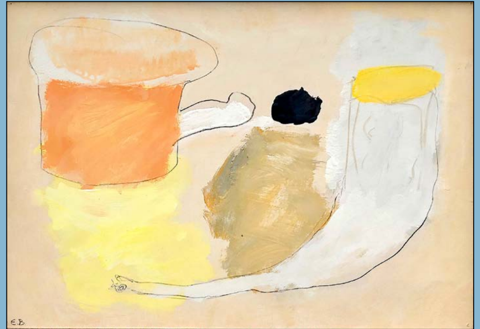
Kompositie 2 vormen, 1982 Gouache 25 x 36 cm