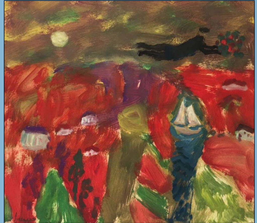
Aanzoek "En route!", 1954 Olieverf op papier 34 x 38 cm