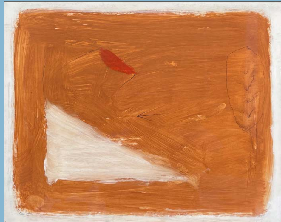
Landschap met liggende driehoek, 1988 Gouache 33 x 40 cm