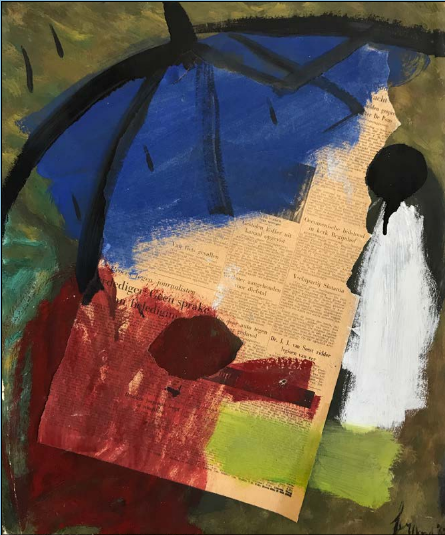
De paraplu, 1962 Gemengde techniek op papier 50 x 43 cm