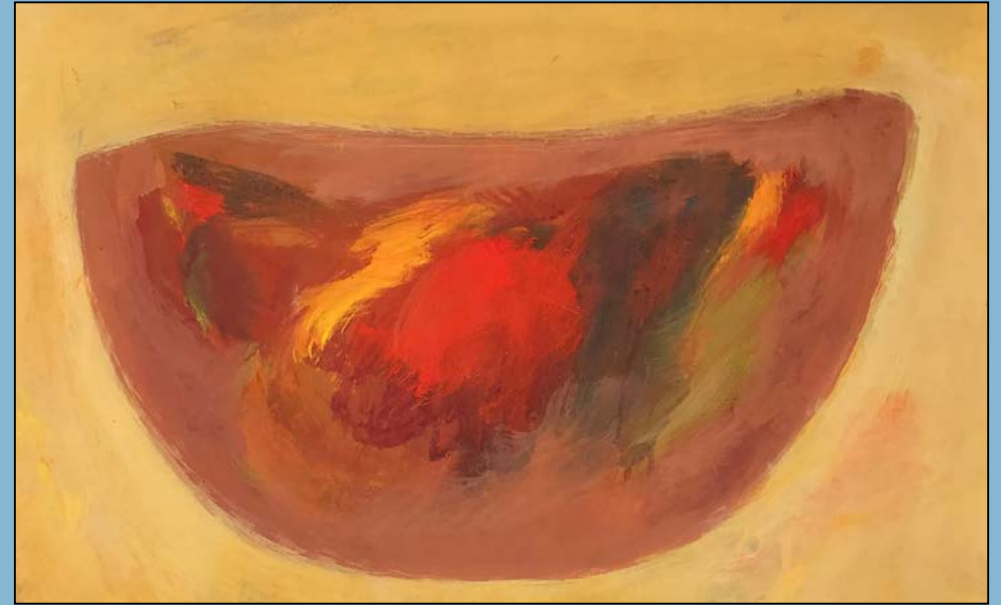
Painted bowl, 1998 Gouache 34 x 52 cm