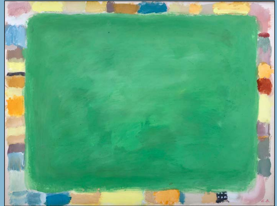
Summerlawn, 1979 Gouache 45 x 60 cm