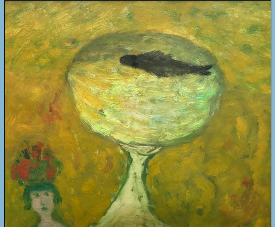
Meisje met viskom, 1952 Olieverf op papier 42 x 48 cm