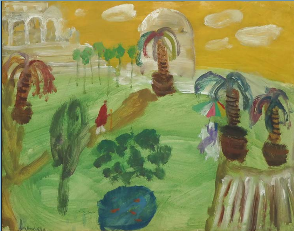
Figures in the park, 1954 Olieverf op papier 42 x 48 cm