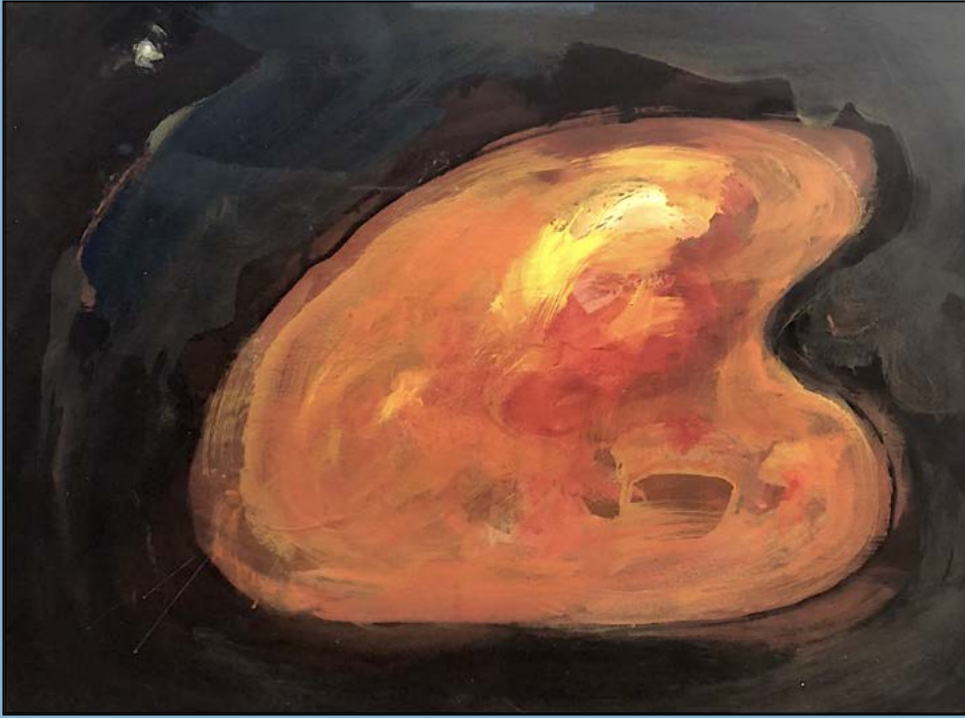
Light and colour, a mystery, 1996 Gouache 36 x 47 cm