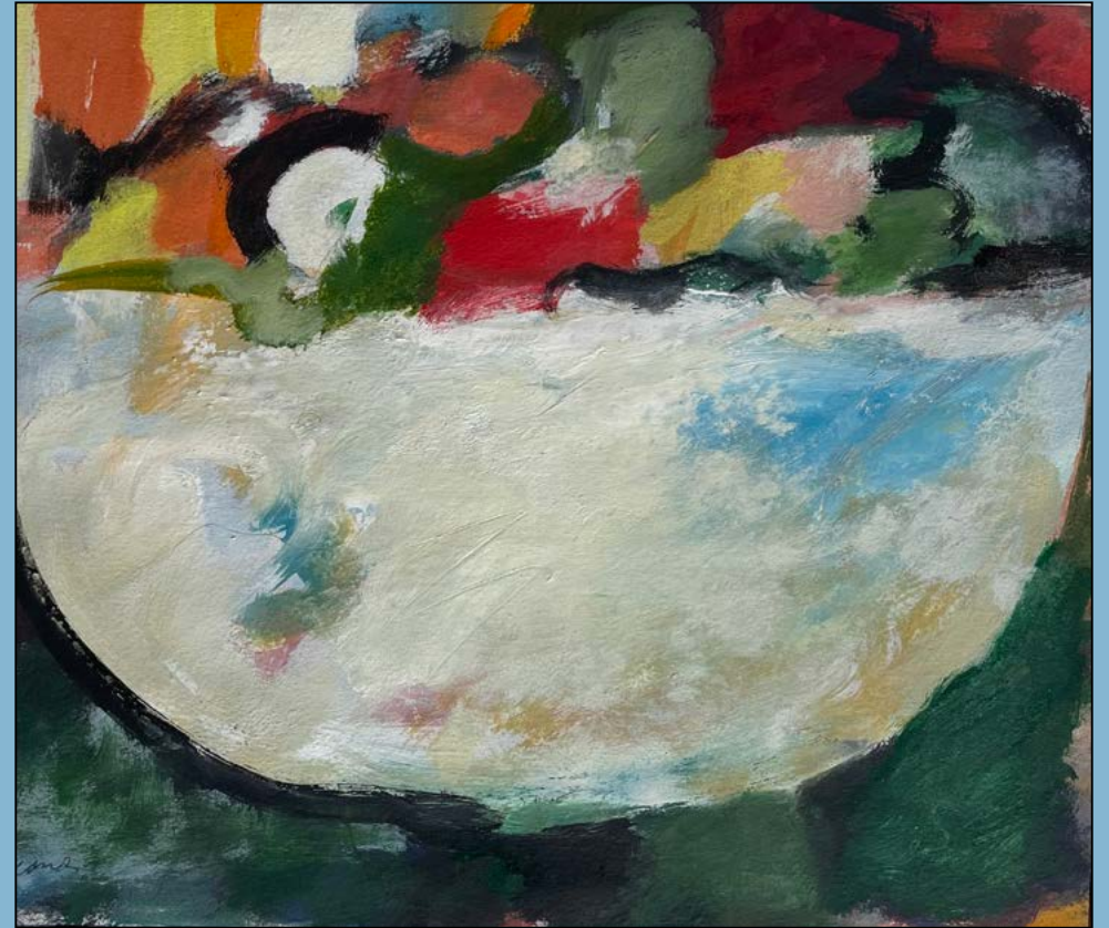
White bowl, 1975 Gouache 29 x 34 cm