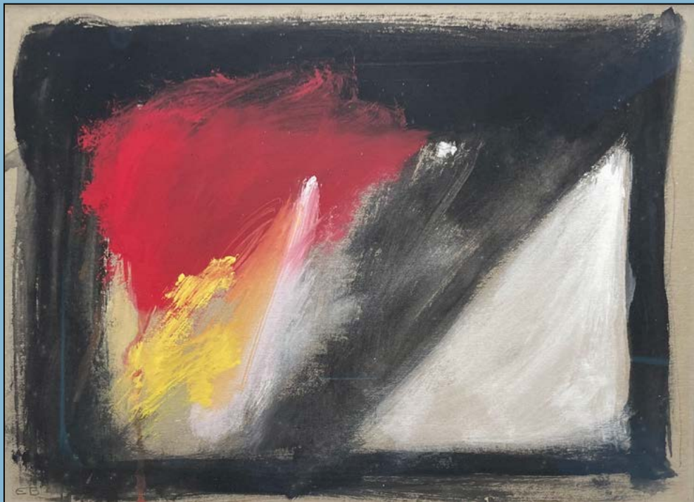
Mystery of light, 1986 Gouache 30 x 42 cm