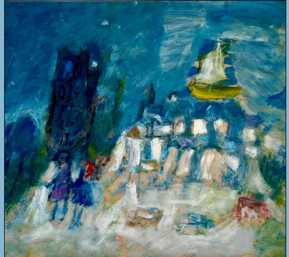
Aan de kust, 1958 Olieverf op papier 46 x 50 cm