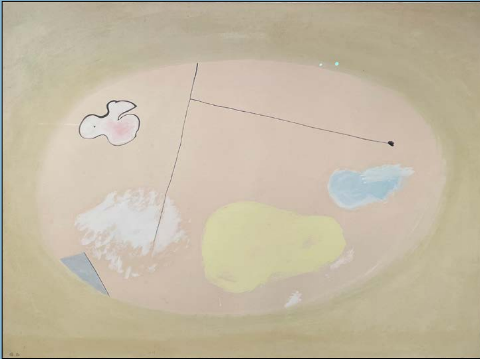
Kompositie in ovaal, 1979 Gouache 52 x 71 cm