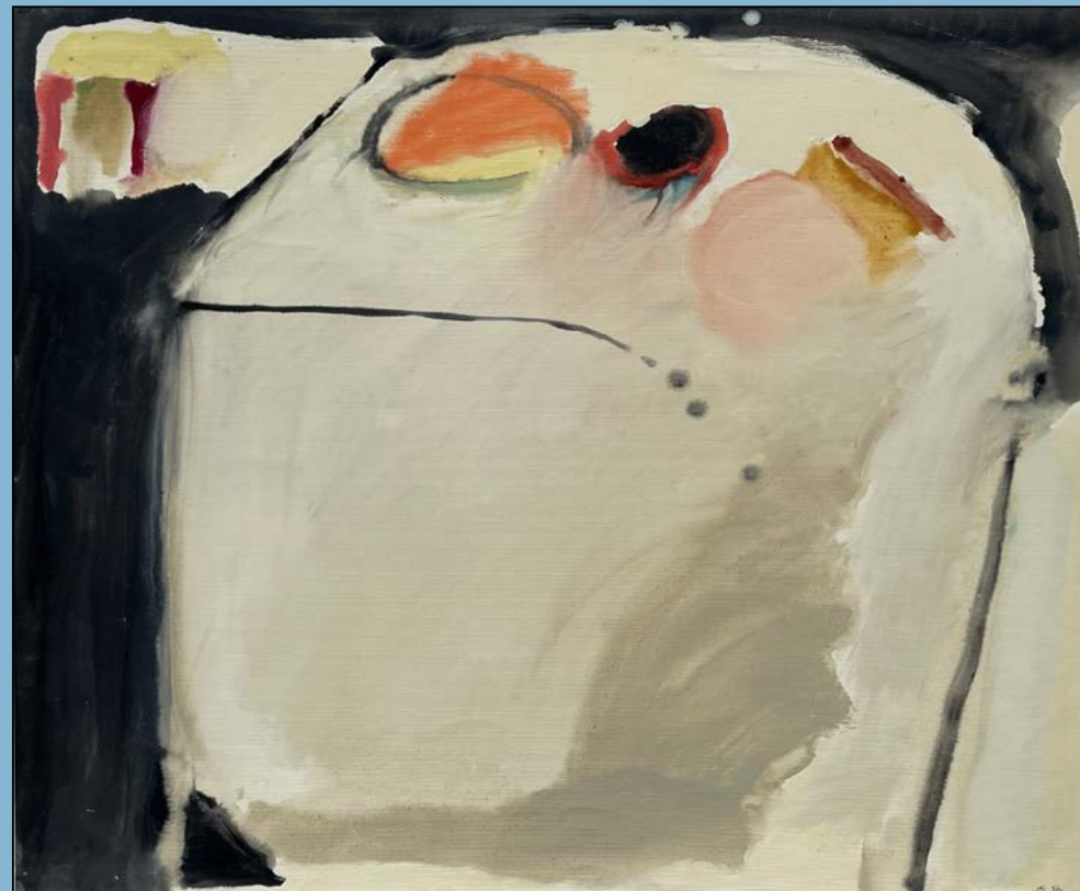
Tafel met stilleven, 1983 Gouache 51 x 61 cm