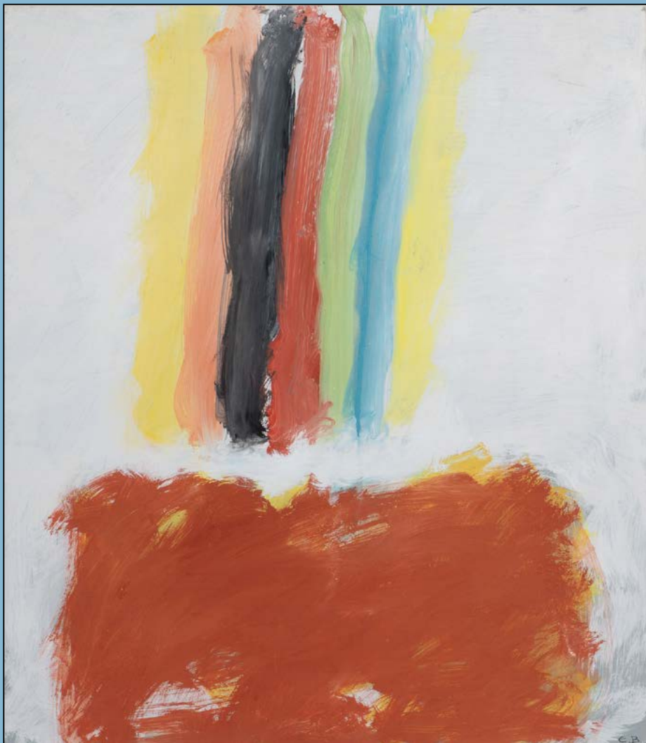
Kompositie met kleurstroken, 1983 Gouache 55 x 48 cm