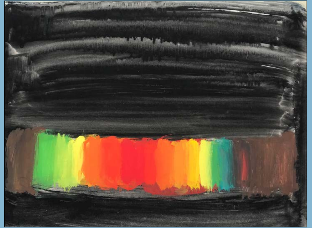
Rainbow, 1994 Gouache 32 x 40 cm