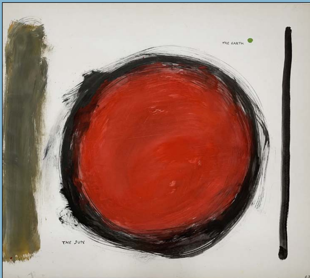
Zon en aarde, 1982 Gouache 70 x 80 cm