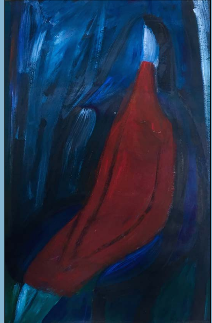
Dame in rode japon, 1961 Olieverf op papier 50 x 33 cm