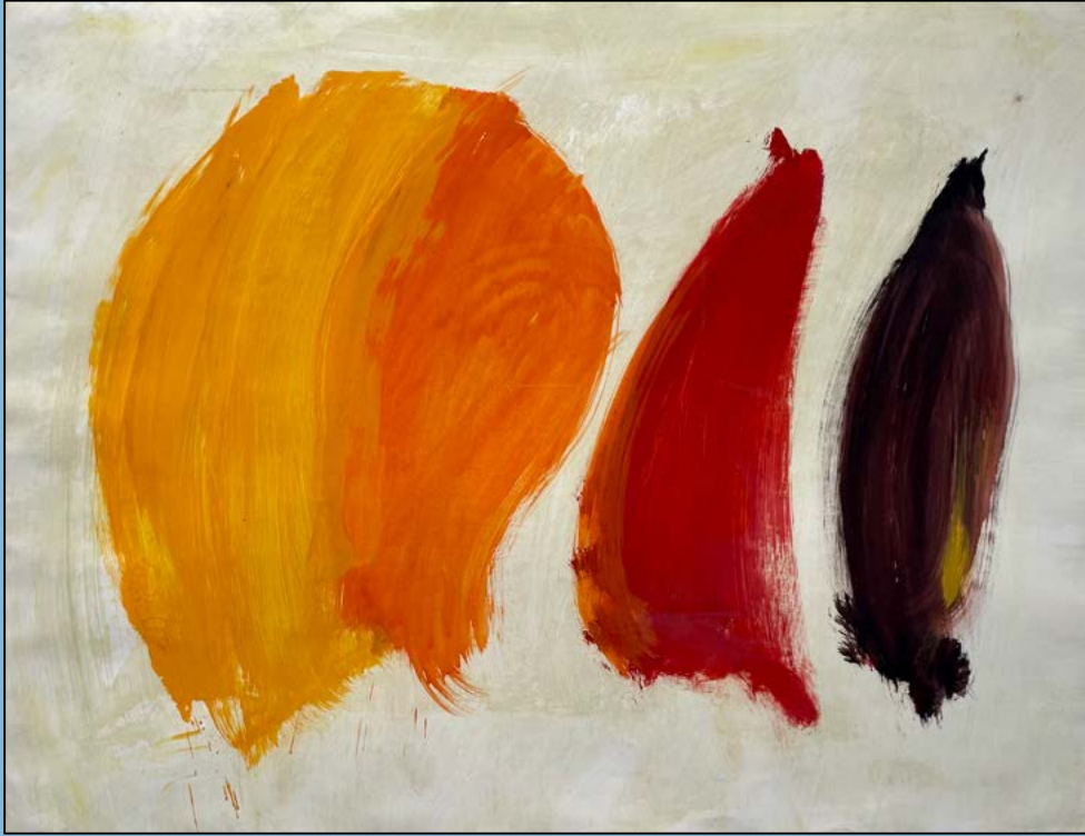
Composition, 1994 Gouache 49 x 64 cm