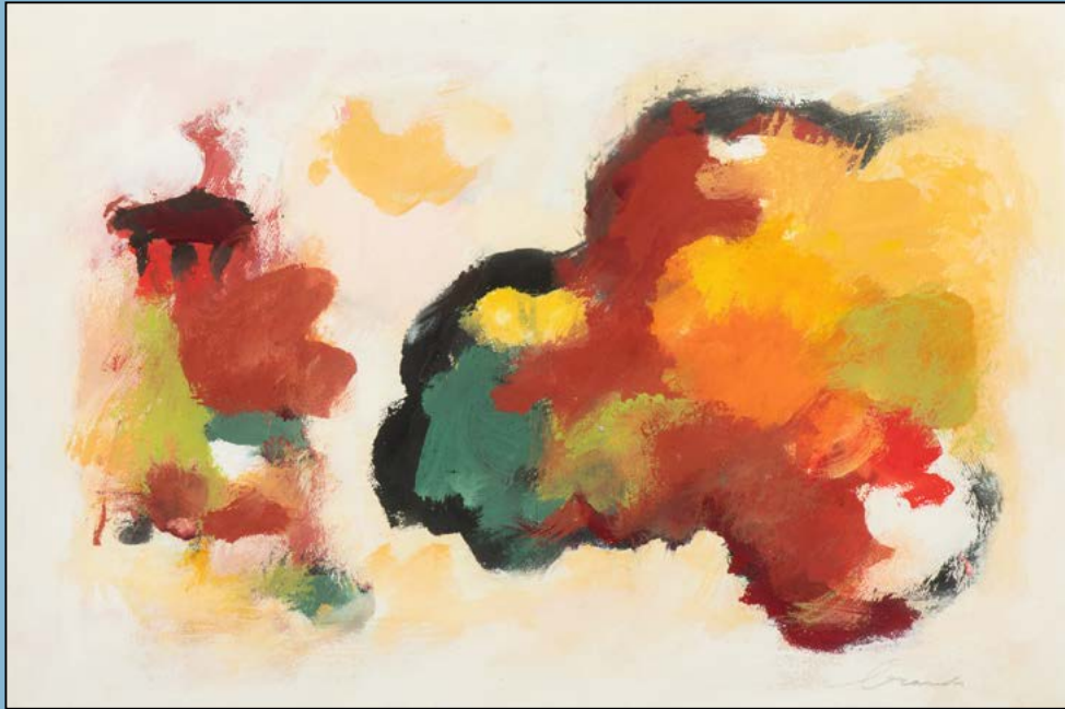
Landschap, een compositie, 1974 Gouache 36 x 53 cm