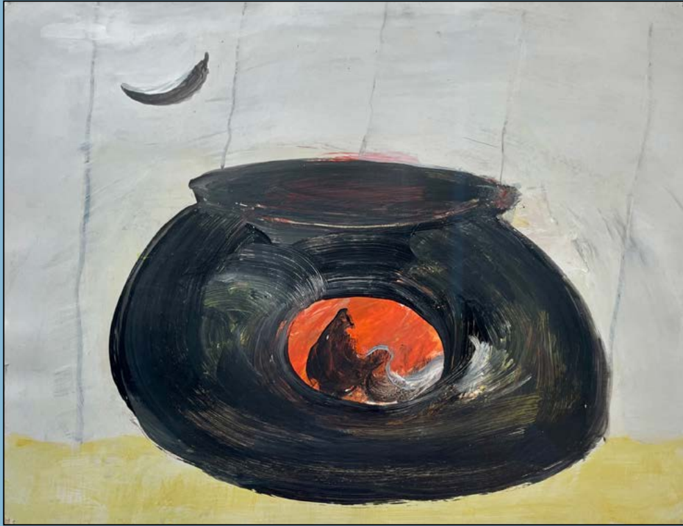
Pot noir au lune oriental, 1995 Gouache 30 x 38 cm