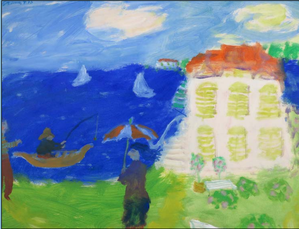
Het huis aan het meer, 1956 Olieverf op papier 43 x 55 cm