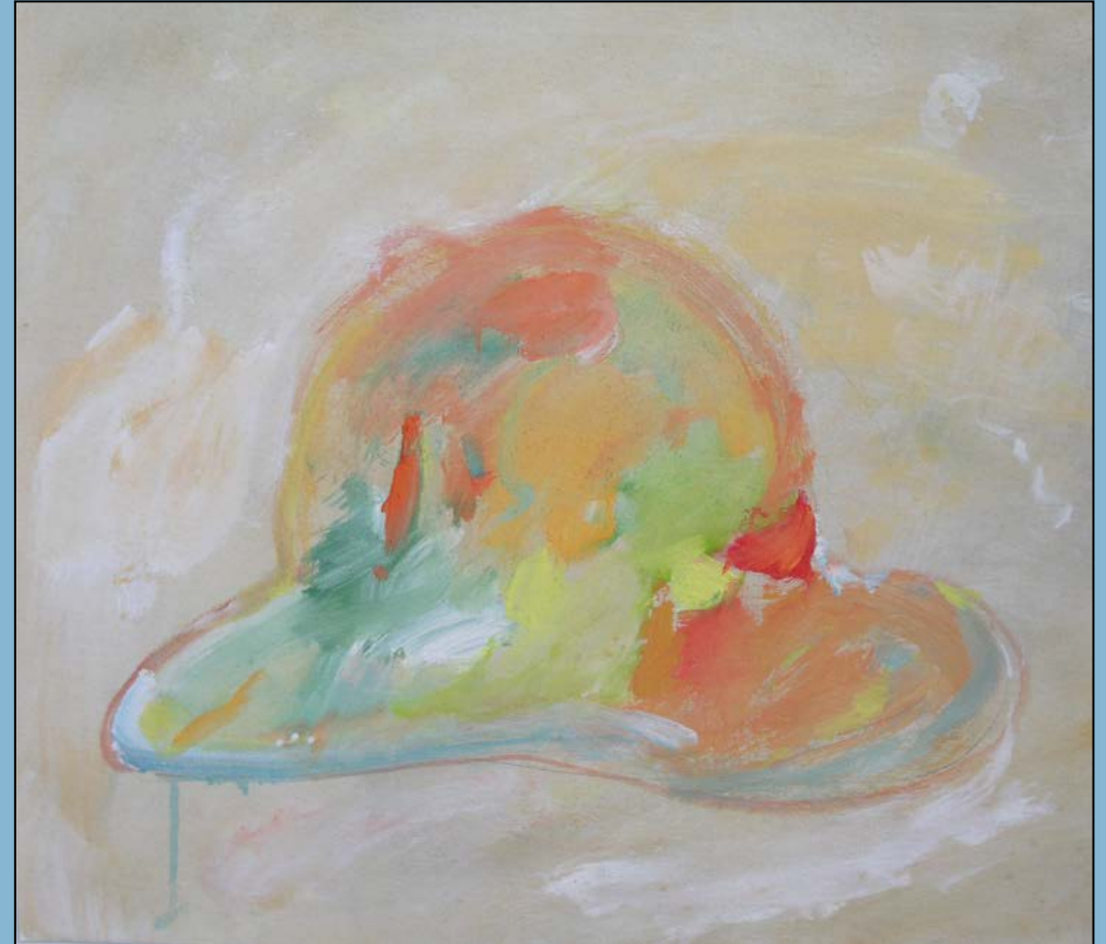
In memoriam, van Gogh, 1986 Gouache 50 x 75 cm