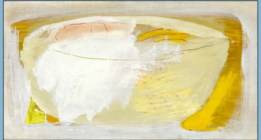
De witte fruitschaal, 1992 Gouache 34 x 51 cm