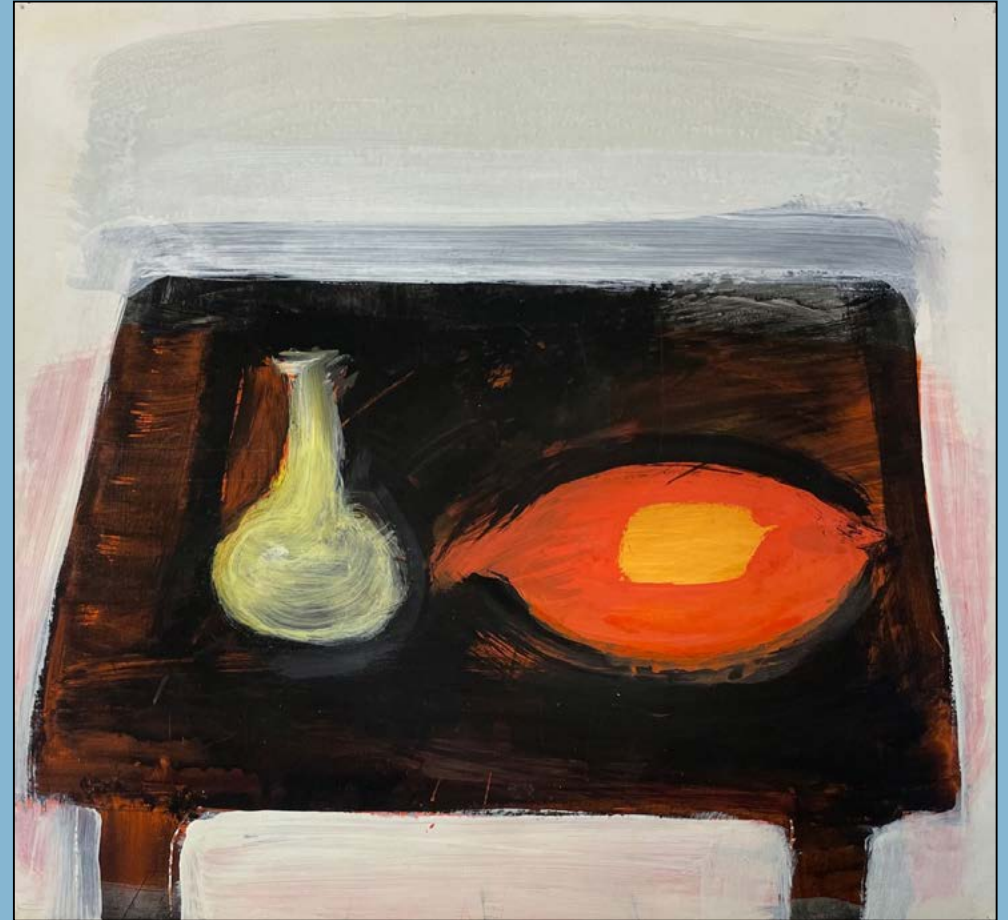
Stilleven met visschotel, 1995 Gouache 31 x 33 cm