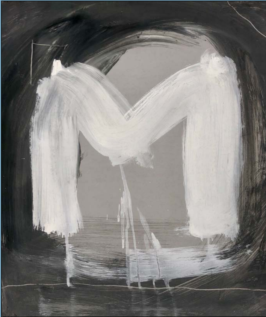
"M" Mystery base of universe, 1986 Gouache 54 x 45 cm