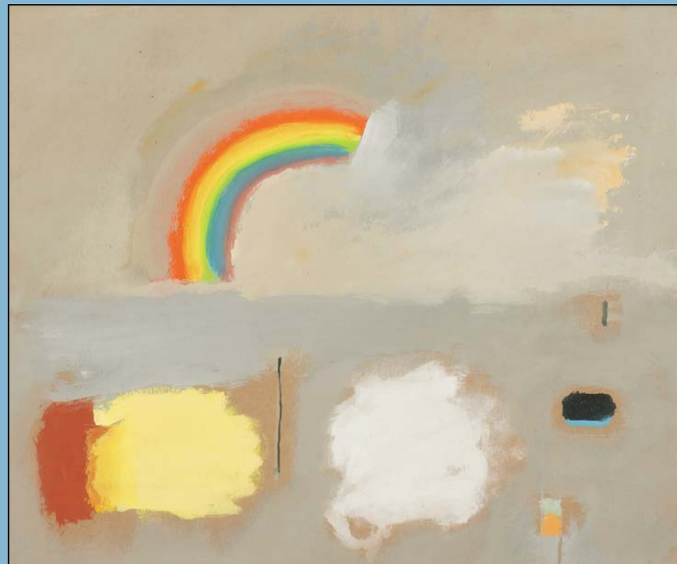
Landschap met regenboog, 1982 Gouache 50 x 60 cm