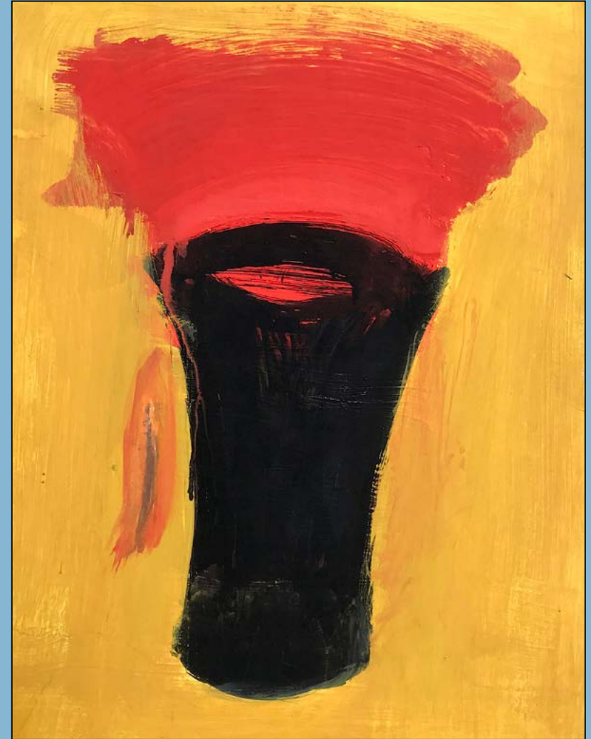
Black vase, 1995 Gouache 40 x 31 cm