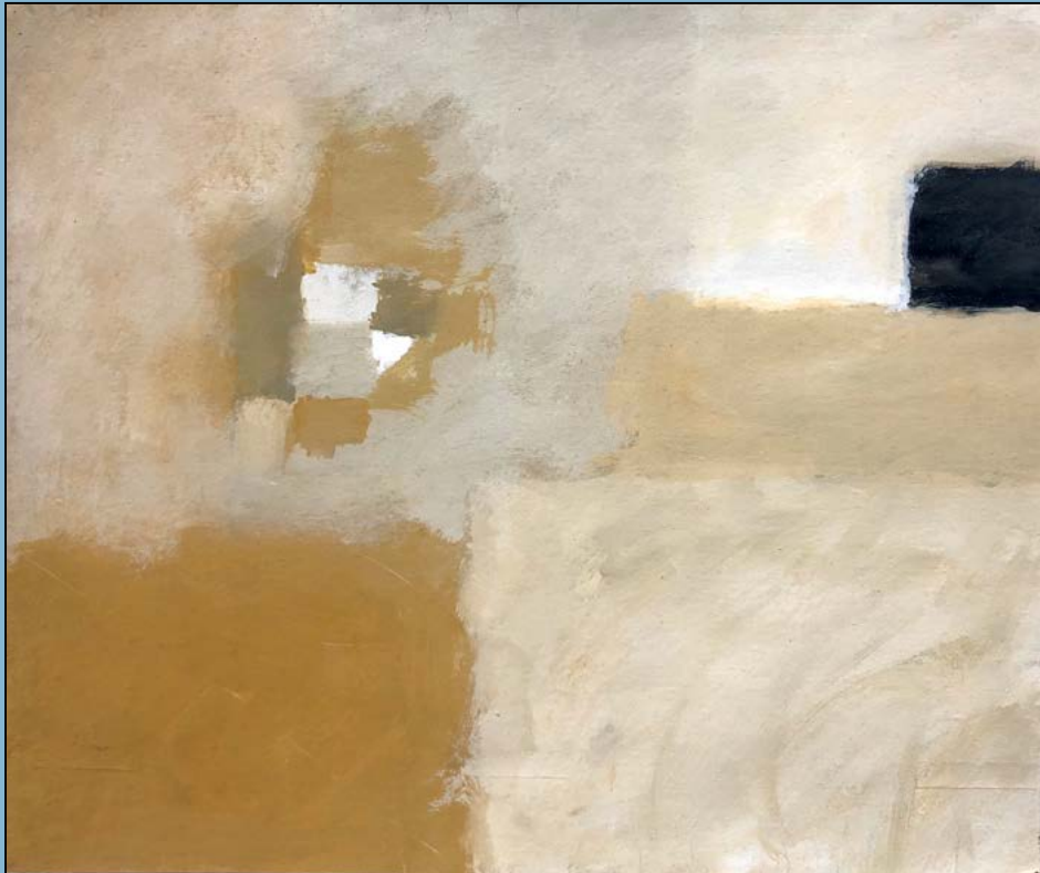
Magisch zwart, 1992 Gouache 42 x 50 cm