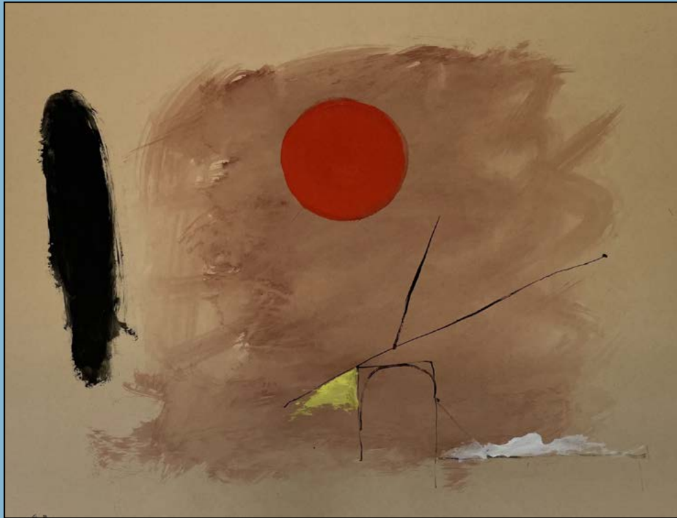
Sunset, 1979 Gouache 50 x 65 cm